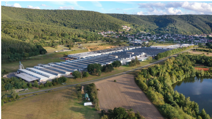
Der rauch Standort in Freudenberg am Main.