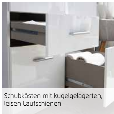
Schubkästen mit kugelgelagerten, leisen Laufschienen