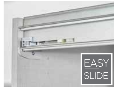
Führungsschienen aus Metall, Schwebetürendämpfer optional