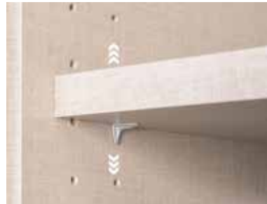
Fachböden 16 mm stark