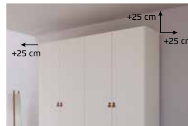
Für die Montage des Schrankes wird folgender Platz benötigt: Schrankhöhe + mind. 25 cm, Schrankbreite + mind. je 25 cm an beiden Seiten.