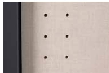
Durchgängige Rasterbohrung zum flexiblen Anordnen von Kleiderstan- ge und Fachböden