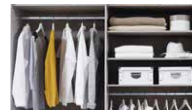
Extras für Drehtürenschränke siehe rauch ORANGE - ZERLEGT Zubehör 1.0. Extras für Schwebetürenschränke siehe rauch ORANGE - ZERLEGT Zubehör 1.1.