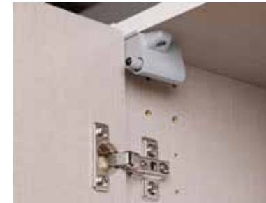
Topfbänder aus Metall, Drehtürendämpfer optional