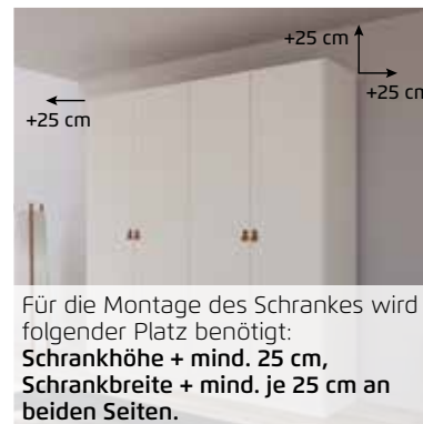
Für die Montage des Schrankes wird folgender Platz benötigt: Schrankhöhe + mind. 25 cm, Schrankbreite + mind. je 25 cm an beiden Seiten.