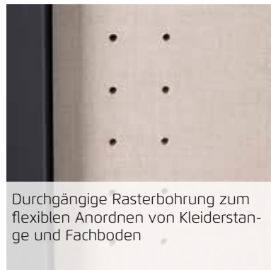
Durchgängige Rasterbohrung zum flexiblen Anordnen von Kleiderstange und Fachboden