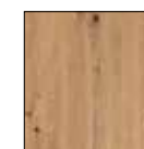
Dekor-Druck Eiche Artisan