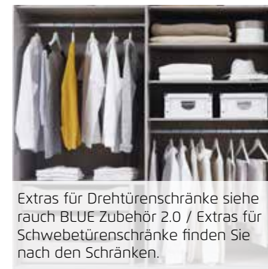
Extras für Drehtütenschränke siehe rauch BLUE Zubehör 2.0 / Extras für Schwebetütenschränke finden Sie nach den Schränken.