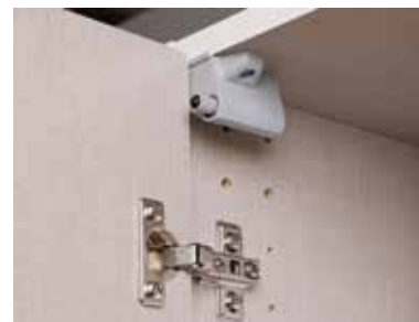
Topfbänder aus Metall, Drehtütendämpfer optional