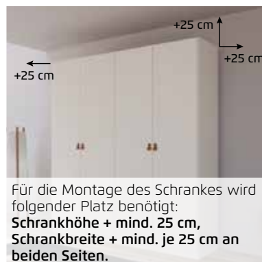
Für die Montage des Schrankes wird folgender Platz benötigt: Schrankhöhe + mind. 25 cm, Schrankbreite + mind. je 25 cm an beiden Seiten.