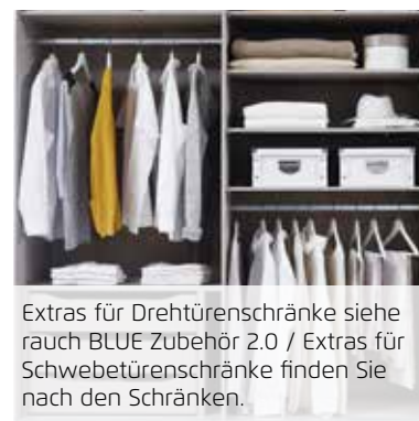
Extras für Drehtütenschränke siehe rauch BLUE Zubehör 2.0 / Extras für Schwebetütenschränke finden Sie nach den Schränken.