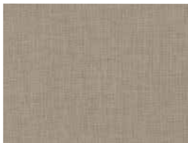
Innenfarbe Dekor-Druck Texline