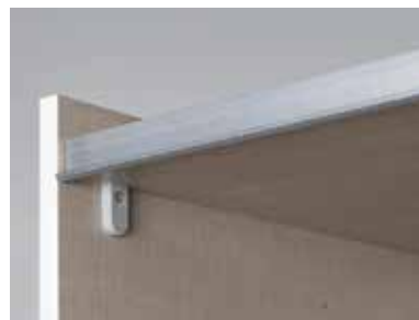
Führungsschienen aus Metall, Schwebetütendämpfer optional