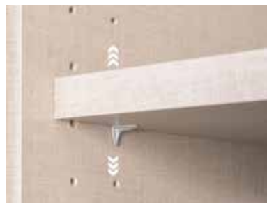
Fachböden 16 mm stark