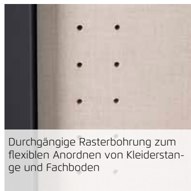
Durchgängige Rasterbohrung zum flexiblen Anordnen von Kleiderstange und Fachboden