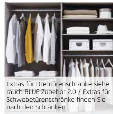
Extras für Drehtütenschränke siehe rauch BLUE Zubehör 2.0 / Extras für Schwebetütenschränke finden Sie nach den Schränken.