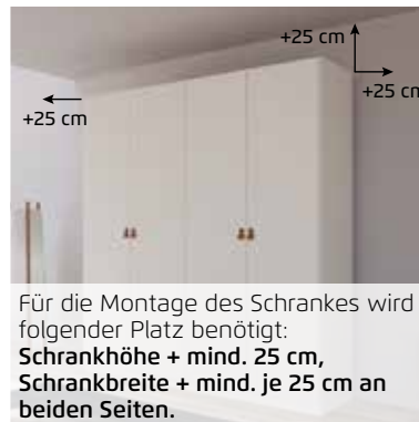
Für die Montage des Schrankes wird folgender Platz benötigt: Schrankhöhe + mind. 25 cm, Schrankbreite + mind. je 25 cm an beiden Seiten.