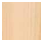
Dekor-Druck Buche natur