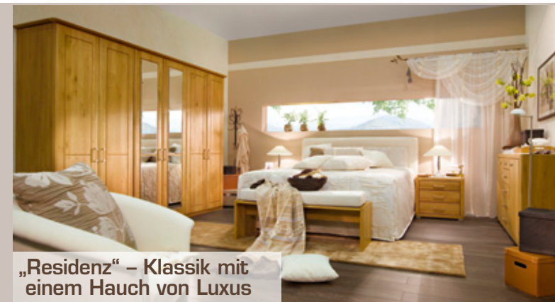
„Residenz“ – Klassik mit einem Hauch von Luxus

Die vier Komplettprogramme „Residenz“ (klassisch-luxuriös), „Castell“ (zeitlos-elegant), „Villa“ (trendy & stilvoll) und „Studio“ (modern & funktional) decken sowohl unterschiedliche Stilrichtungen wie auch Preiskategorien ab, sodass die Wünsche nahezu aller Kaufinteressenten erfüllt werden können. Das neue Label stieß in Köln auf eine außergewöhnlich hohe Resonanz – kein Wunder, schließt es doch in perfekter Weise eine Lücke im Handel. Und natürlich steht das OmR-Team dem Händler in puncto Koje-Gestaltung mit individueller Beratung zu fairen Rahmenbedingungen zur Seite. Weiterhin können auch unterstützende Werbematerialien zur Verfügung gestellt werden. bs