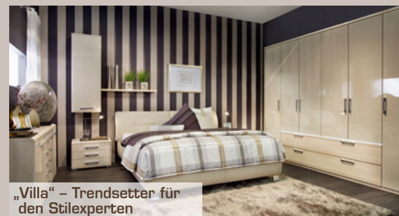
„Villa“ – Trendsetter für den Stilexperten

Der System-Schrank „Castell“ ist in der Farbkombination Kernbuche/Hochglanz Creme oder in Kernbuche uni mit massiven Fronten erhältlich. Die Verbindung zwischen Bett und Schrank schaffen sowohl der Holz-Winkelfuß wie auch die beidseitig angebrachte Massivholzblende. Das 60 cm hohe Bett zeichnet sich zudem durch sein formschön gestepptes Kopfteil aus.