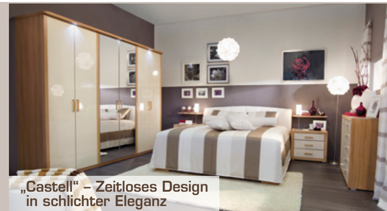
„Castell“ – Zeitloses Design in schlichter Eleganz

Das Polsterbett dieser Schlafzimmerwelt verfügt über eine extra hohe Liegefläche von 65 cm. Zwei verschiedene Bezugstoffe zieren das aufwendig gearbeitete Kopfteil, das auf die Form der Schranktüren abgestimmt wurde. Der System-Schrank ist sowohl in Eiche als auch in Erle Dekor mit massiven Fronten erhältlich.