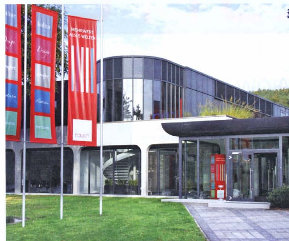
Das Verwaltungs- und Ausstellungsgebäude in Freudenberg

liche Schulabschlüsse sind für den Zugang zu den einzelnen Ausbildungsgängen erforderlich, wobei das Auswahlverfahren von Rauch Bewerber mit guten Zeugnissen bevorzugt – in dem der ersten Auswahl folgenden Bewerbungstest überprüft die Firma dann das Allgemeinwissen der Kandidaten. Der Test beinhaltet auch eine Diskussionsrunde. ■